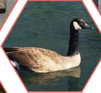
BERNACHE DU CANADA Branta canadensis