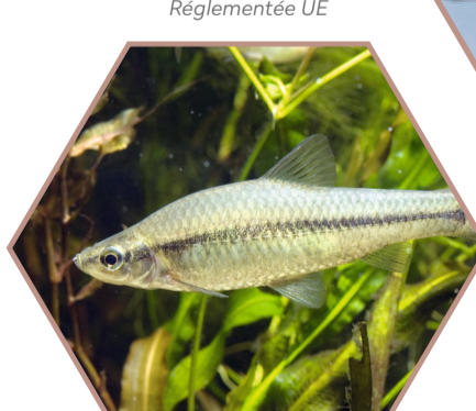
PSEUDORASBORA Pseudorasbora parva Réglementée UE