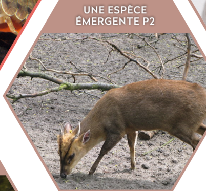
MUNTJAC DE CHINE Muntiacus reevesi Réglementée UE