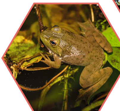
GRENOUILLE TAUREAU Lithobates catesbeianus