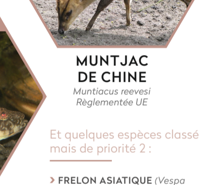
GOBIE DE KESSLER Ponticola kessleri

Et quelques espèces classées comme émergentes mais de priorité 2 :