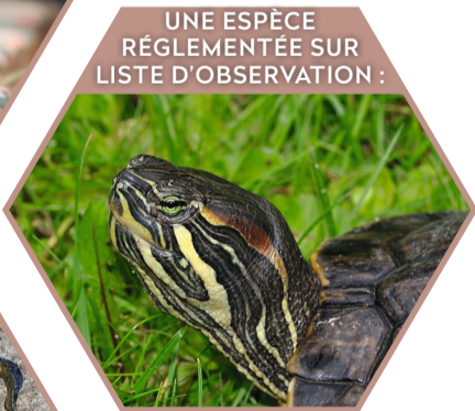
TORTUE DE FLORIDE Trachemys scripta Réglementée UE