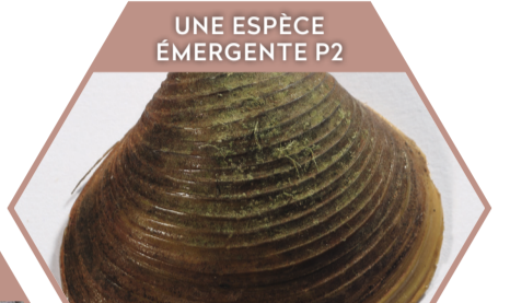
CORBICULE STRIOLÉE Corbicula fluminalis