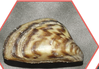
MOULE ZÉBRÉE Dreissena polymorpha