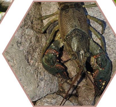
ECREVISSE À PINCES BLEUES Faxonius virilis Réglementée UE