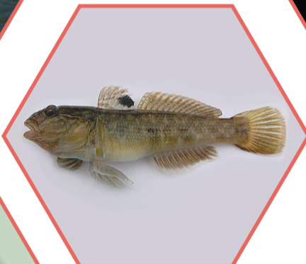
GOBIE À TÂCHE NOIRE Neogobius melanostomus