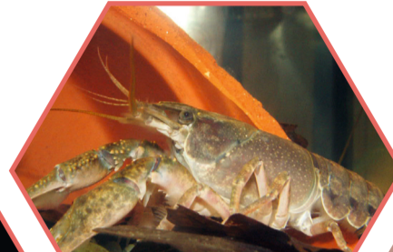
ECREVISSE CALICOT Faxonius immunitus