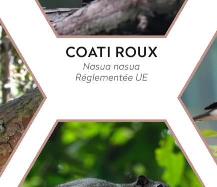
COATI ROUX Nasua nasua Réglementée UE