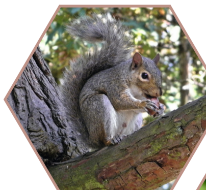
ECUREUIL GRIS Sciurus carolinensis Réglementée UE