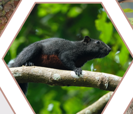
ECUREUIL À VENTRE ROUGE Callosciurus erythraeus Réglementée UE