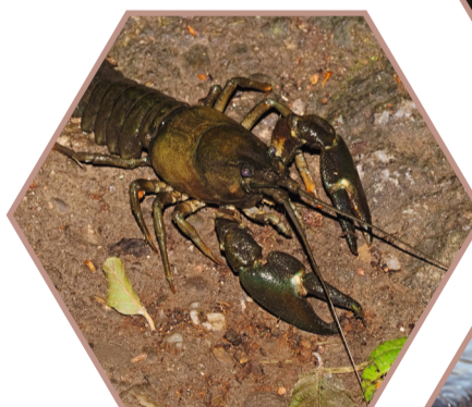
ECREVISSE DE CALIFORNIE Pacifastacus leniusculus Réglementée UE