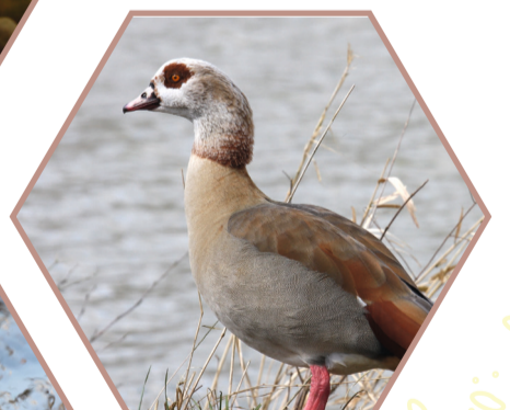
OUETTE D'ÉGYPTÉ Alopochen aegyptiaca Réglementée UE