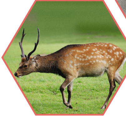
CERF SIKI Cervus nippon