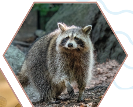
RATON LAVEUR Procyon lotor Réglementée UE