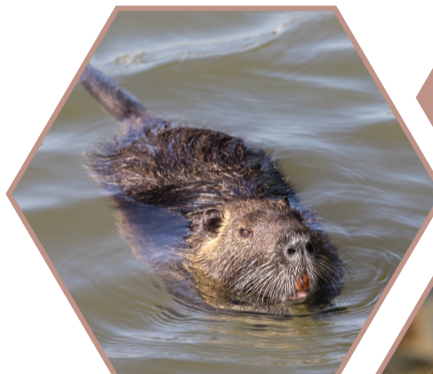
RAGONDIN Myocastor coypus Réglementée UE