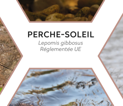
PERCHE-SOLEIL Lepomis gibbosus Réglementée UE