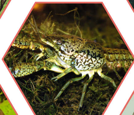
ECREVISSE MARBRÉE Procambarus virginalis Réglementée UE