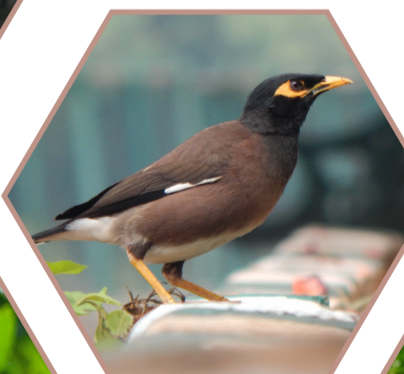
MARTIN TRISTE Acridotheres tristis Réglementée UE