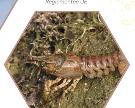
ECREVISSE AMÉRICAINNE Faxonius limosus Réglementée UE

Vous avez reconnu une de ces espèces ? Contactez :