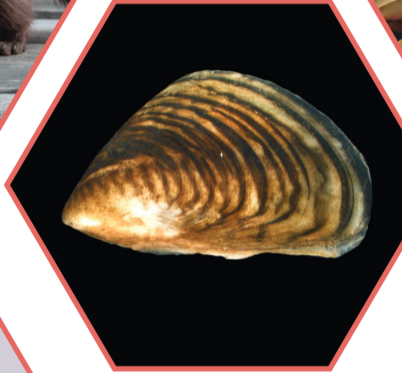
MOULE QUAGGA Dreissena rostriformis bugensis