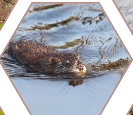
RAT MUSQUÉ Ondatra zibethicus Réglementée UE