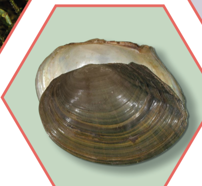
ANODONTE CHINOISE Sinanodonta woodiana