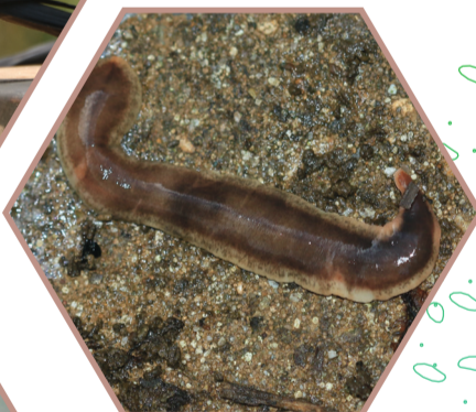
VER PLAT DE NOUVELLE-ZÉLANDE Arthurdendyus triangulatus Réglementée UE