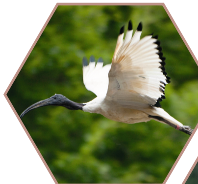
IBIS SACRÉ Threskiornis aethiopicus Réglementée UE