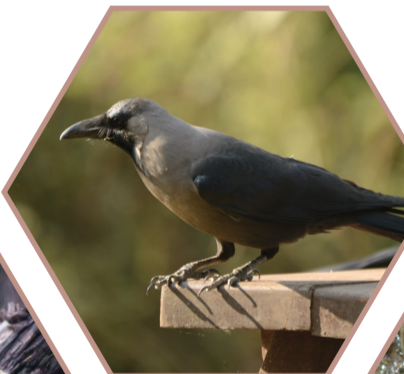
CORBEAU FAMILIER Corvus splendens Réglementée UE