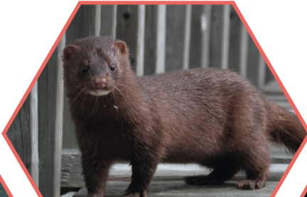
VISON D'AMÉRIQUE Mustela vison